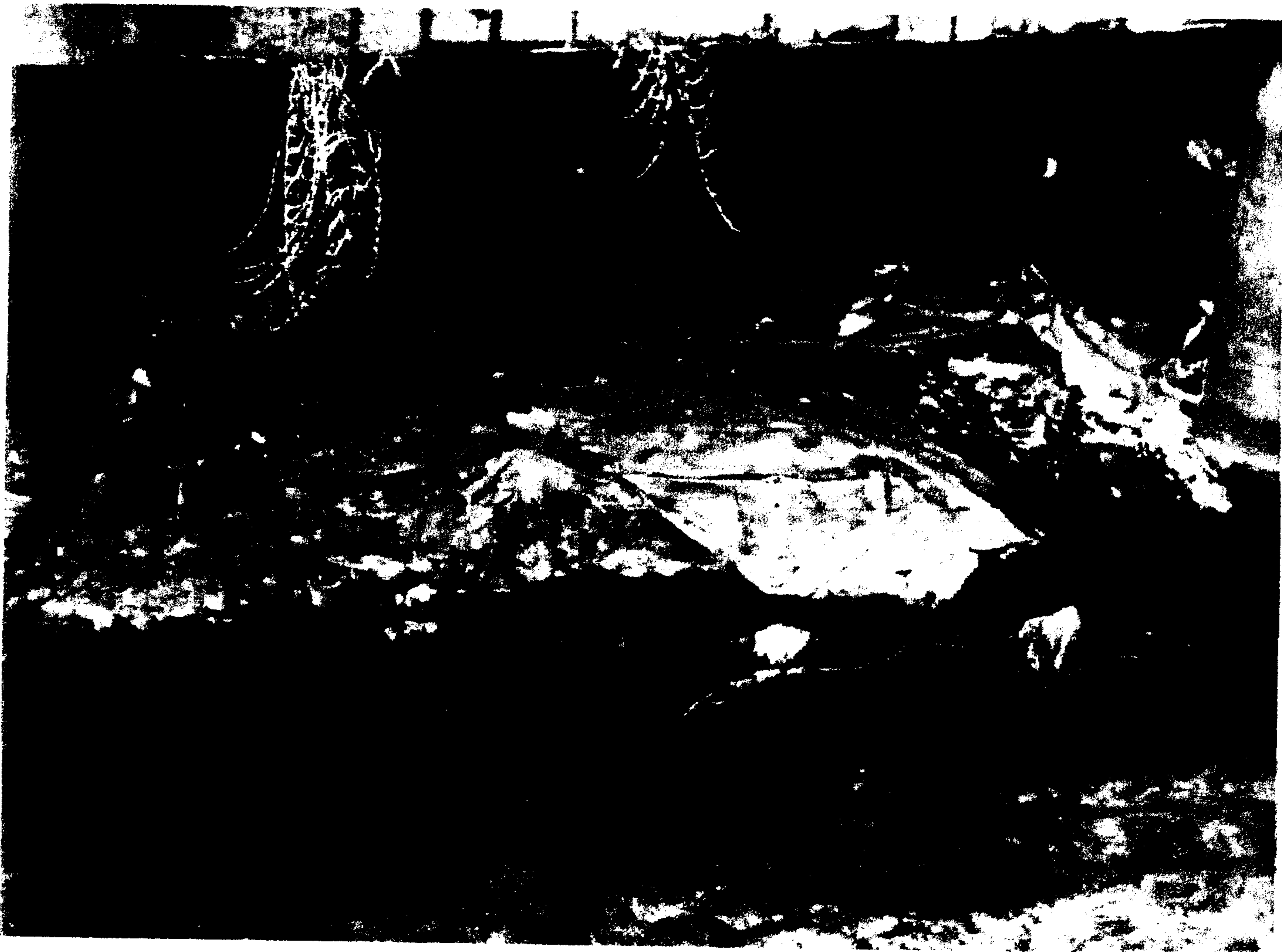
Foto 1 e 2 – la Roggia Vettabbia nei pressi di via Bazzi e del Centro Leoni